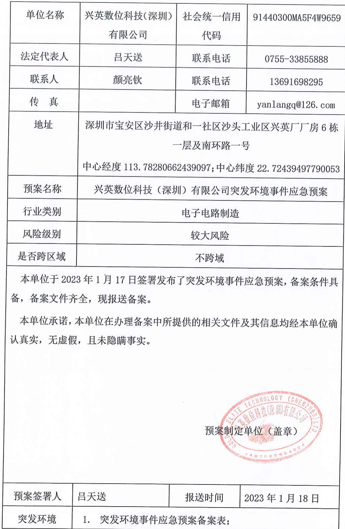
企业事业单位突发环境事件应急预案备案表